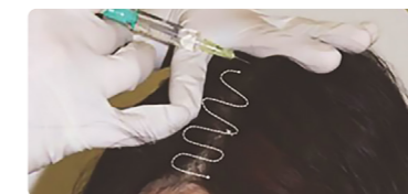
Voor handmatige injecties wordt een 31G naald geadviseerd, bij voorkeur van 4 mm (mesonaaldje). Handmatige injecties kunnen pijnlijk zijn. Een fiool van 5 ml XL Hair mag daarom gemixt worden met 0,8 ml xylocaine-/adrenalineoplossing.

Het is belangrijk te weten dat de injectiediepte maximaal 0,5 - 1 mm mag zijn om het product boven de haarpapillen te houden. Injecteer je te diep dan gaat het product grotendeels verloren in de dermis. Handmatig injecteren kan daarom het best met gebruik van een zgn. mesonaaldje (4 mm). In onze ogen is de meest optimale manier om XL Hair te injecteren door gebruik te maken van een intradermale injector. Niet alleen omdat de injectiediepte dan kan worden ingesteld maar ook omdat de snelheid van injecteren (microneedling) een belangrijke bijdrage levert aan het stimuleren van de bloedcirculatie. Bovendien is injecteren met bijvoorbeeld een U225 intradermale injector niet pijnlijk, dit in tegenstelling tot het toedienen van handmatige injecties.