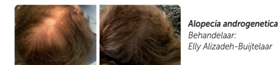
Alopecia androgenetica Behandelaar: Elly Alizadeh-Buijtelaar